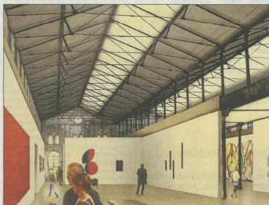
Unter dem Dach der Gießereihalle präsentiert sich die Konkrete Kunst: So sieht es das Siegerbüro Stanton Williams.